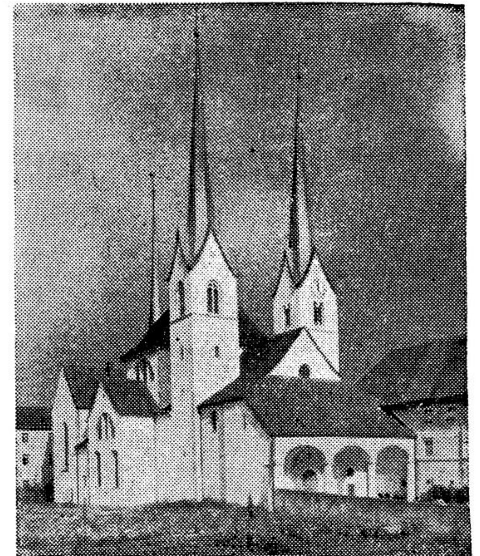
Klosterkirche von Muri

Mit der Rückgabe der Scheiben hat der Kanton Aargau seinen drei schon vorhandenen berühmten Beispielen, wo die alten Glasgemälde an ihrem ursprünglichen Standort zu sehen sind, nämlich die Kirchen von Königsfelden